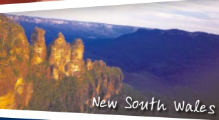
New South Wales